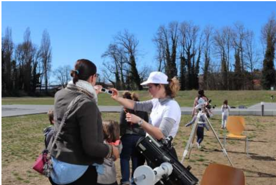
Samedi des bibliothèques 2019 : Atelier animé par Astro Découvertes