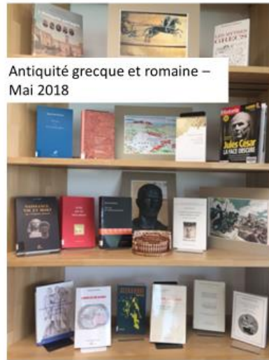
Antiquité grecque et romaine – Mai 2018

Association Bibliothèque publique de Vully-les-Lacs