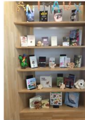
Animaux – Juin 2018

Association Bibliothèque publique de Vully-les-Lacs