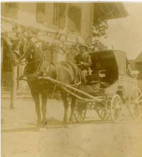
Calèche postale de Salavaux, 1879.