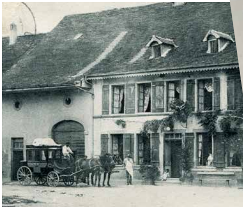
Poste Salavaux-Cudrefin, 1908.