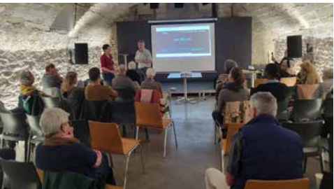
« Première projection de la série The Chosen, au Caveau, dimanche 5 octobre, avec des personnes de toutes confessions confondues et le soutien de la commune d'Avenches. Les prochaines rencontres sont prévues le 18 janvier, le 7 février, le 1 er mars et le 22 mars, à 17h15, au Caveau. Bienvenue à tous ! » □