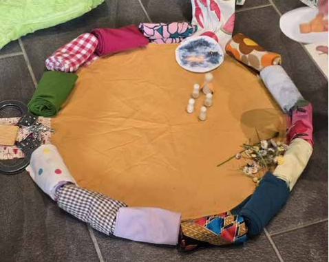
« Un soleil de prière pour les enfants, avec un rayon de soleil déroulé pour chaque moment d'une histoire ou pour chaque intention de chaque prière. »