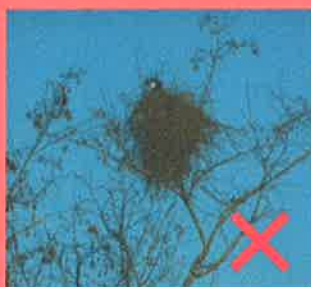
Nid de pie