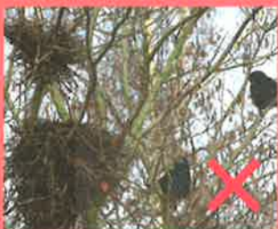
Nid de corbeau freux